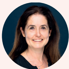
Marine Homo Chef de projet HEC Life Project